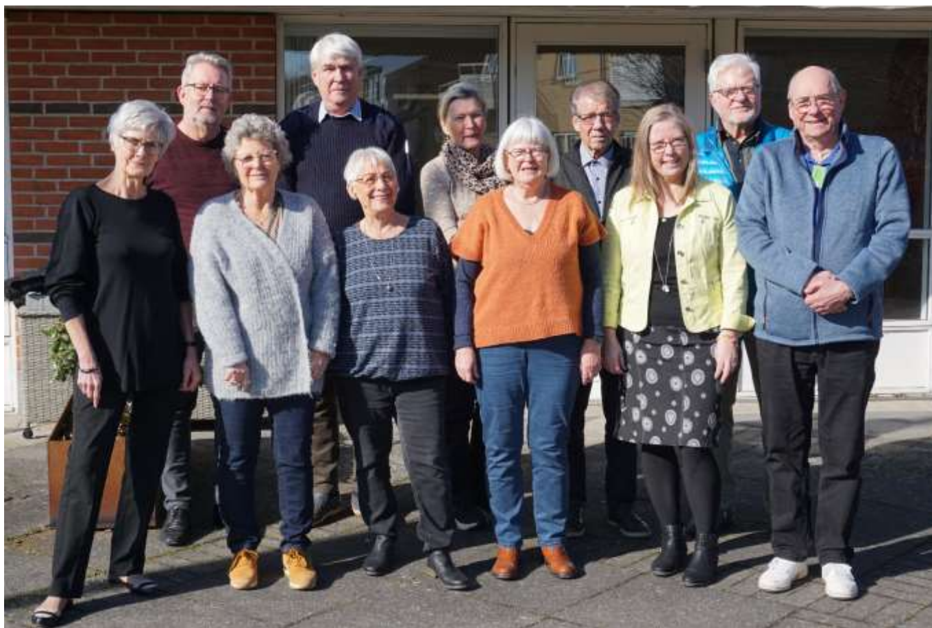
Bestyrelsen for GrønnegadeCentret